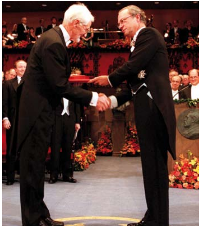
Professor Jens Christian Skou modtager Nobelprisen i kemi (1997) for sin opdagelse af natrium-kalium-pumpen

• Flere forskningsprojekter med internationale partnere. Aarhus Universitet ønsker at udvikle internationale kontakter og forskningsnetværk med henblik på at udbygge universitetets position i den globale elite. Der vil derfor blive arbejdet på at inkludere internationale partnere i forskningsprojekter, hvor