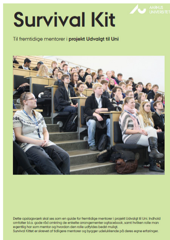
Figur 4: Survival Kittedet efter første gennemløb af projektet.

Mentorerne i anden og tredje gennemløb af projekt Udvalgt til Uni vil løbende have til opgave at udbygge og forbedre Survival kittedet.