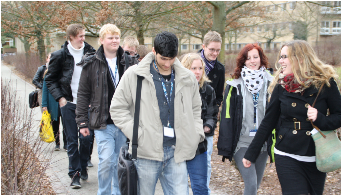
Figur 7: Mentor fra første gennemløb (yderst til højre) viser sin mentorgruppe rundt, fortæller om livet som studerende og forsøger samtidigt at involvere alle eleverne – også den stille dreng forrest til venstre.

En evalueringsrapport fra projekt Udvalgt til Uni