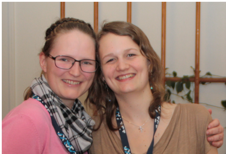
Figur 3: Ét af mentorparrene fra første gennemløb. De er tydeligvis glade for samarbejdet i parret.

At mentorerne arbejder i par og ikke alene styrker således både mentorernes arbejde og elevernes udbytte af projektet.