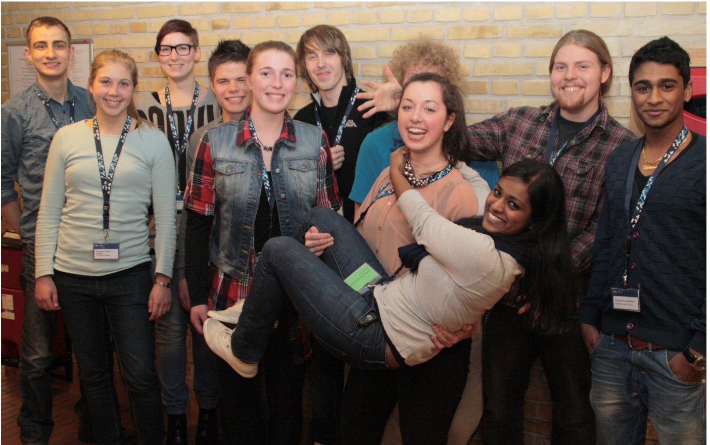
Figur 9: Én af mentorgrupperne første gennemløb. Pigen der bliver løftet er gruppens mentor.

Elever, lærere såvel som projektledelsen er således imponerede over det arbejde mentorerne har lagt i planlægningen af besøgene og deres oprigtige interesse i eleverne og villighed til at dele ud af personlige erfaringer.