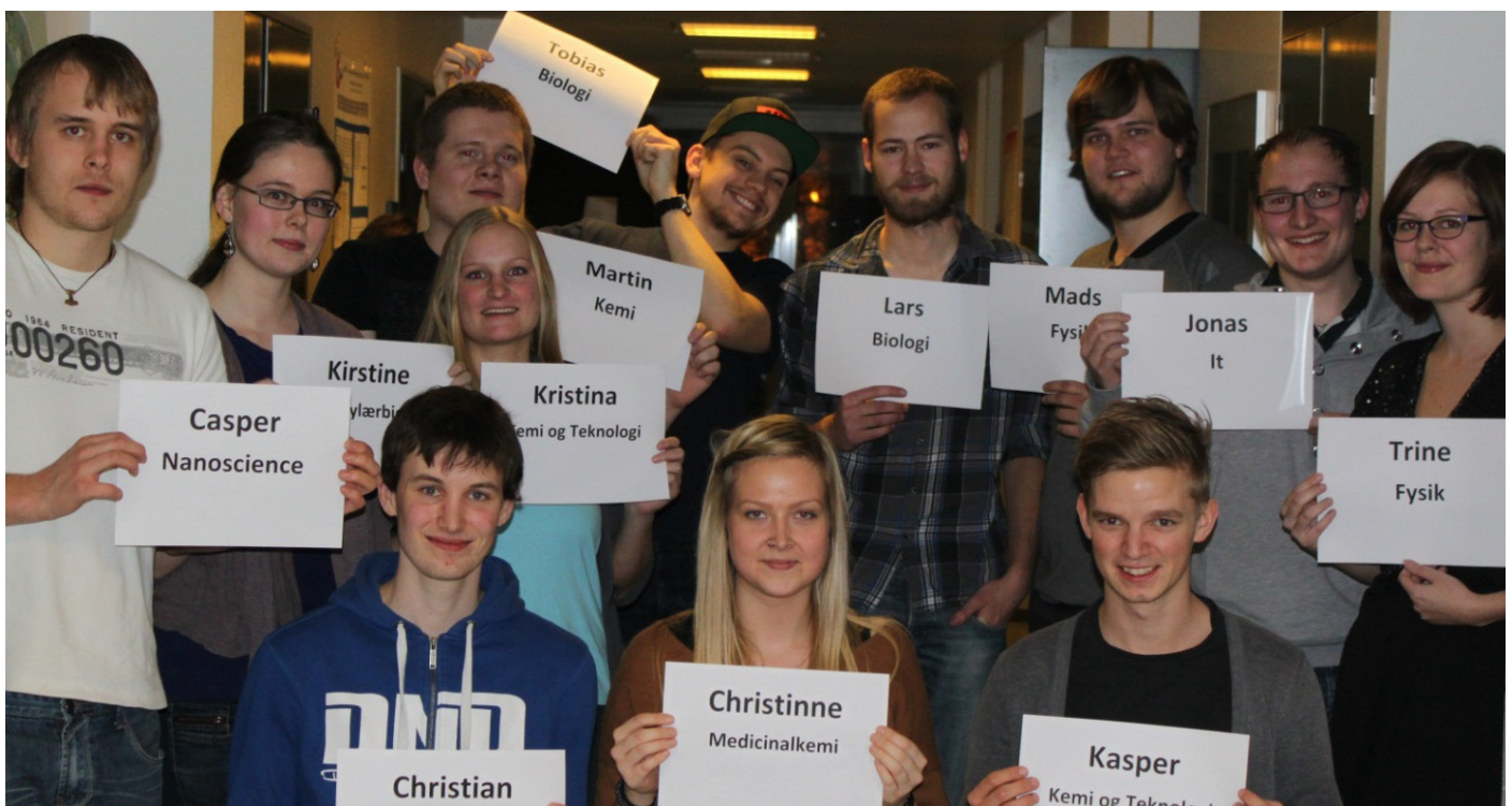
Figur 1: Mentorerne i anden gennemløb af Udvalgt til Uni.

Mentorholdet bestod i første gennemløb af syv kvindelige og fem mandlige mentorer, og de repræsenterede uddannelserne således: tre fra fysik, en fra matematik, to fra nanoscience, en fra molekylærbiologi, en fra medicinalkemi, en fra kemi, to fra biologi og en fra molekylærmedicin. I andet gennemløb er der ansat fire kvindelige og otte mandlige mentorer, der repræsenterer uddannelserne på følgende måde: En fra bacheloruddannelsen i it, to fra fysik, en fra matematik, en fra nanoscience, en fra molekylærbiologi, en fra medicinalkemi, en fra kemi, to fra biologi og to fra kemi og teknologi.