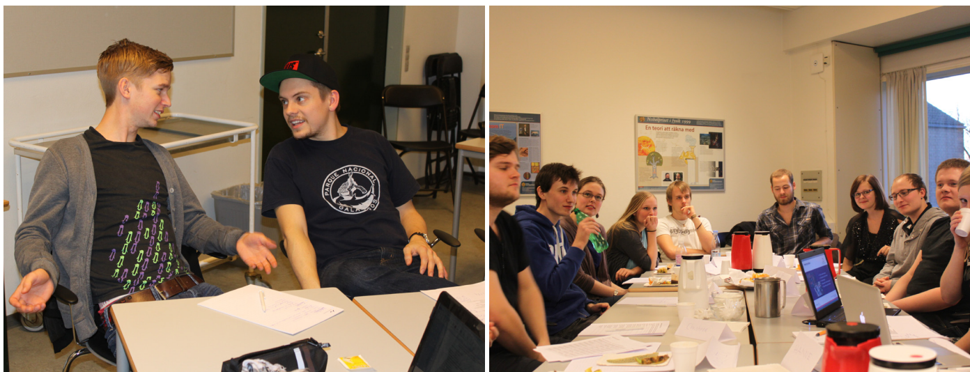
Figur 2: Mentorer fra andet gennemløb til intrømøde.

Mentorerne bliver endvidere informeret om de gymnasiale uddannelser og om gymnasieelever som overordnet målgruppe samt om Udvalgt til Unis specifikke målgruppe - stx/htx-elever med matematik på A-niveau, der har udvist et talent for matematik og naturvidenskab, samtidig med at de kommer fra familier, hvor ingen af forældrene har gået på universitetet.