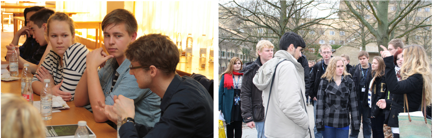
Figur 8: Mentorer (yderst til højre på begge billeder) fra første gennemløb der fortæller deres mentorgrupper om livet som universitetsstuderende.

En evalueringsrapport fra projekt Udvalgt til Uni