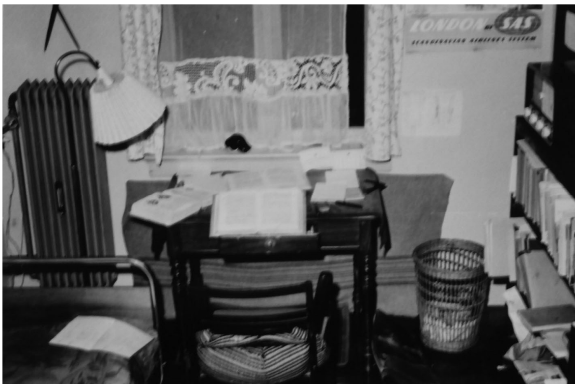
Mit kolde studereværelse i Tunøgade 18, Århus fra 1954 til 57

kuskeslag for at få varme i fingrene. Det var absolut ikke rart at skulle overleve i de 15-17 grader, som temperaturen højst kunne holdes på om vinteren. Læsevanter blev nye, højt elskede beklædningsgenstande.