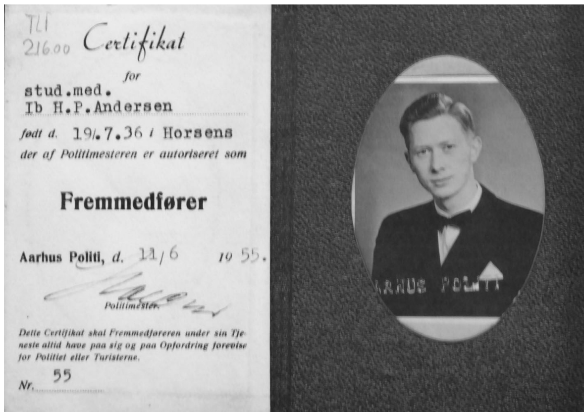
Mit certifikat for bestået fremmedføreruddannelse i Århus 1955

Den første sommer hjemmefra, sommeren 1955, havde jeg besluttet mig for at bruge tid til at give anatomien en ekstra skalle, og samtidig var jeg blevet glad for at bo hjemmefra. At være turistfører var en god undskyldning for at blive i Århus frem for at rejse hjem til mine forældre i ferien. Mine turistførerindtægter, som blev på 446 kr., kunne lige dække de ekstraudgifter, der var til mad og ophold i Århus frem for i Horsens. Det blev en god læsesommer, hvor jeg begyndte at få styr på det svære anatomi fag.